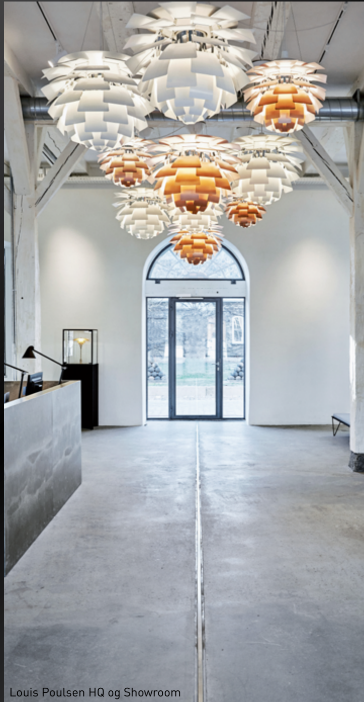
Louis Poulsen HQ og Showroom